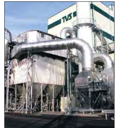
Foto: Rauchgasreinigung der TVS

lage Zorbau bei Weißenfels. Hausmüll wird in der MBRA zerkleinert und sortiert. Ein geringer Teil (etwa 2.400 t jährlich) wird direkt zur Müllverbrennungsanlage in Zorbau transportiert. Etwa ein Viertel des angelieferten Hausmülls hat nach der Behandlung eine „Korngröße“ über 80 mm und wird zur TVS verbracht. Der verbleibende Teil des Hausmülls wird nach Intensivrotte und Trocknung nochmals separiert. Ein Anteil wird ebenfalls zur TVS in Rudolstadt transportiert. Nur der verbleibende Rest wird in der Verbrennungsanlage Zorbau thermisch behandelt.