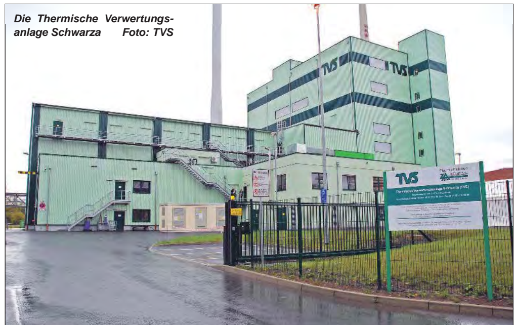
Die Thermische Verwertungsanlage Schwarza

Der Zweckverband Abfallwirtschaft Saale-Orla lädt schon jetzt zum „Tag der offenen Tür“ am 17. September 2011