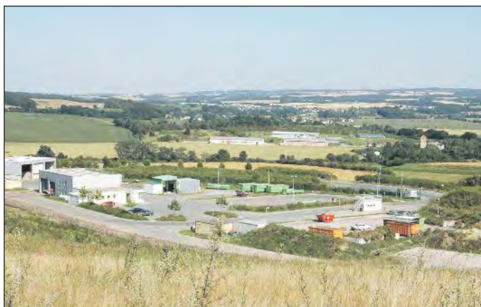
Foto: Blick auf den Eingangsbereich vom Abfallbehandlungszentrum Wiewärthe

lage Zorbau bei Weißenfels. Hausmüll wird in der MBRA zerkleinert und sortiert. Ein geringer Teil (etwa 2.400 t jährlich) wird direkt zur Müllverbrennungsanlage in Zorbau transportiert. Etwa ein Viertel des angelieferten Hausmülls hat nach der Behandlung eine „Korngröße“ über 80 mm und wird zur TVS verbracht. Der verbleibende Teil des Hausmülls wird nach Intensivrotte und Trocknung nochmals separiert. Ein Anteil wird ebenfalls zur TVS in Rudolstadt transportiert. Nur der verbleibende Rest wird in der Verbrennungsanlage Zorbau thermisch behandelt.