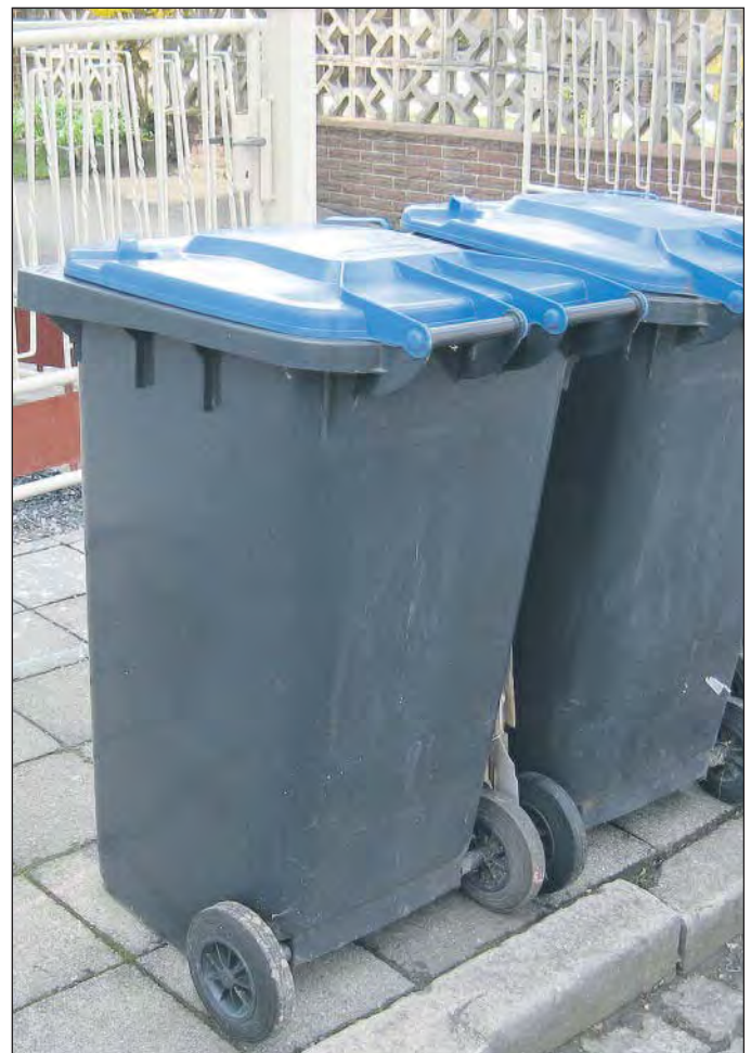
Foto: Bereit gestellte Altpapiertonnen

Deshalb rufen wir dazu auf, uns derartige Vorkommnisse zu melden!