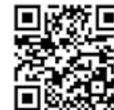
QR-Code zum ZASO-Bürgerportal

Auf der ZASO-Webseite www.zaso-online.de finden Sie auch einen entsprechenden Button mit der Verlinkung zum Bürgerportal.